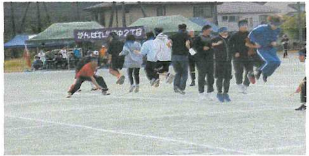
(息を合わせて大縄跳び)