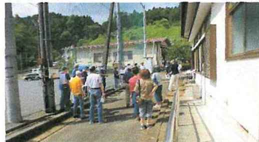
(準備のために集まっていた方々)