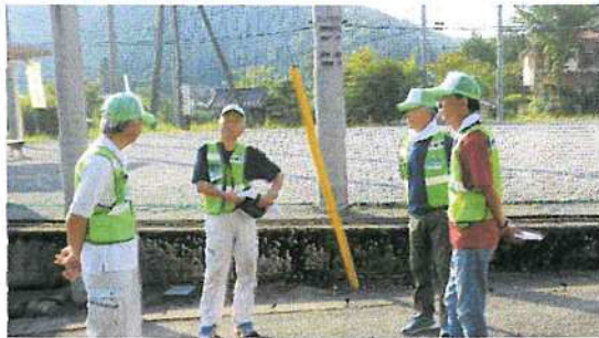
(事前の打ち合わせ)