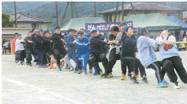
(綱引きワッショイ、引きずられそう!!)