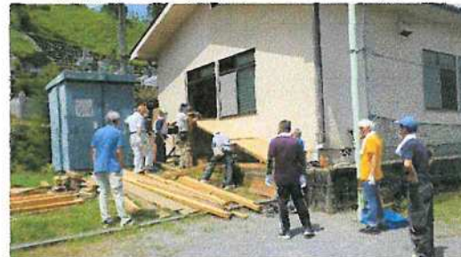
(ステージ入口用スロープの設置)