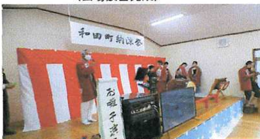
(オープニング演奏 囃子保存会)

新型コロナウイルスの状況が明確には好転しない中、新型コロナウイルス前より規模縮小の形で開催しましたが、皆様のご協