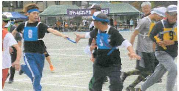
(鮮やかなバトンタッチ 年齢別リレー)