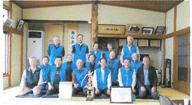
(優勝の賞状、トロフィー、賞品を前に)

清和会グランドゴルフ部優勝 10/6に開催された青梅市高齢者クラブ連合会主催のグランドゴルフ大会午後の部で和田町清和会グランドゴルフ部が優勝し、都大会第1ブロック大会(西多摩地区)への出場権を獲得しました。おめでとうございます。