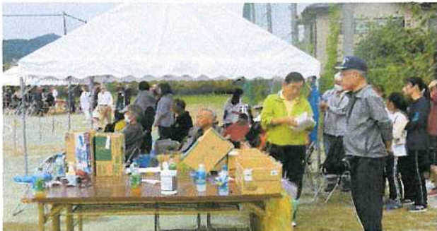
(和田町応援席：次の種目は)