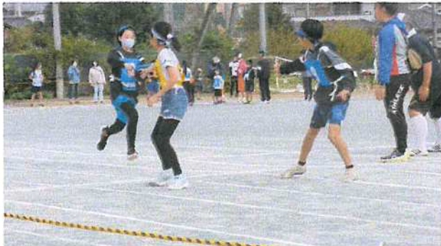
(リレーの醍醐味、小学生リレー)