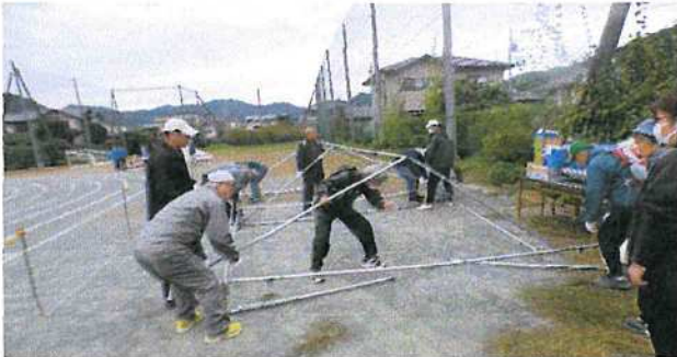
(まずは応援席テントの組み立て)

今回は種目の一部に対抗戦を取り入れ、応援にも熱が入りました。体育部長さんはじめご協力いただいた多くの皆様、選手の皆様のおかげで運動会を楽しむことができました。ありがとうございました。