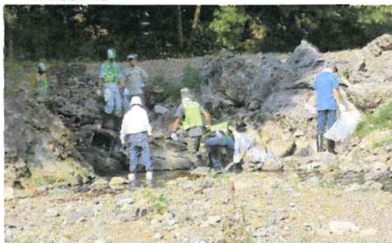
(多摩川1万人清掃の活動)

8/6 (日) 8:00～多摩川1万人清掃(参加者:市担当課長、環境美化委員、自治会三役、理事、清和会及び自治会有志)