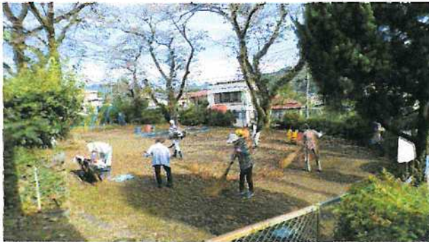
(子供たちが安全に遊べるようにと願って)

清和会による児童公園清掃 10/11 (水) 8:30より清和会による児童公園の清掃が行われました。ありがとうございます。