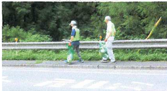
(活動範囲は梅ヶ谷トンネルの先まで)

8/6 (日) 8:00～多摩川1万人清掃(参加者:市担当課長、環境美化委員、自治会三役、理事、清和会及び自治会有志)