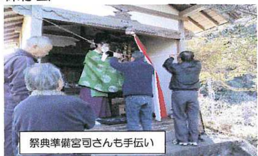
祭典準備宮司さんも手伝い