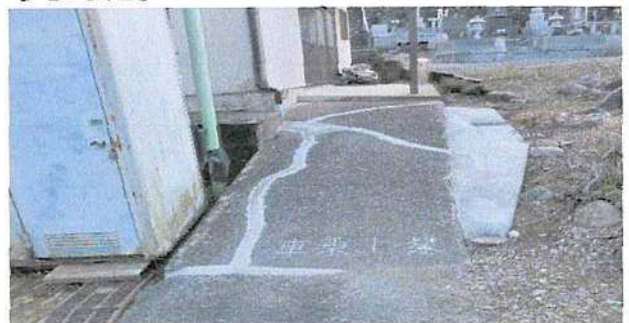
右側コンクリート補強はスロープのスレを防ぐためのものです。

体育館前のコンクリート通路の大きな亀裂を修理しましたのでつまづく心配がなくなりました。