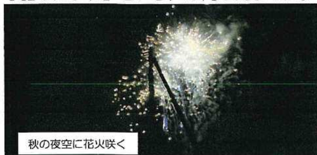
秋の夜空に花火咲く

11/23 青梅五小創立150周年記念の花火を卒業生はもちろん、多くの人々が楽しみました。「もし、150年前に卒業した人達がこの花火を見れるとしたらロマンチックな話だよな」という声が聞こえました。