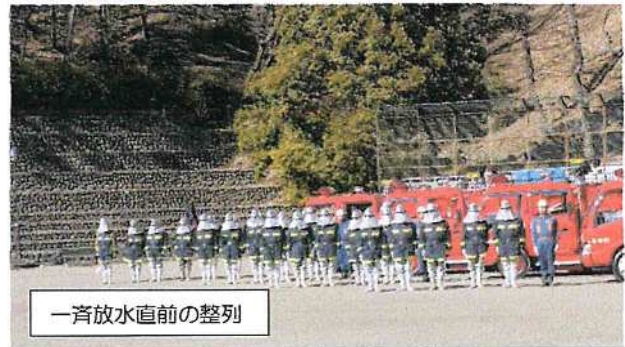
一斉放水直前の整列

2月16日、市役所商工観光課によりベンチ2基が赤ぼっこに増設されました。ベンチに座りながら眺望をお楽しみください。