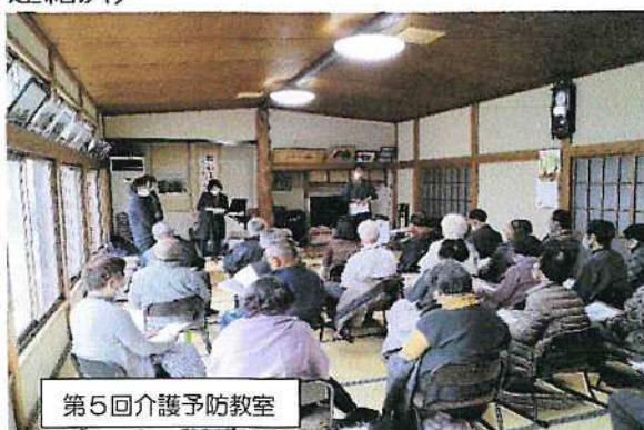
第5回介護予防教室

(3) 12/19(火) 第5回介護予防教室開催 テーマ「口の健康を守る」包括支援センターうめその、清和会、自治会の共同事業。次回「家の中でもできる軽体操」(※回覧板で連絡済)