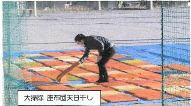
大掃除 座布団天日干し

(4) 12/3(日) 会館、体育館年末大掃除 ・参加、協力者は自治会三役、理事、清和会、体育館利用団体でした。天気が良かったので座布団も干しました。