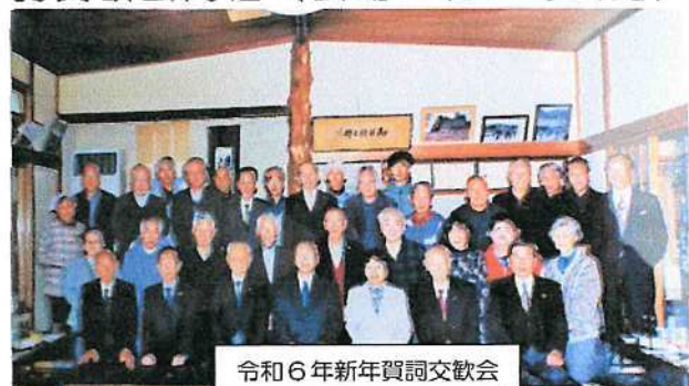
令和6年新年賀詞交歓会

(6) 1/3(水) 午前10時、令和6年新年賀詞交歓会開催 (会場：和田町会館)