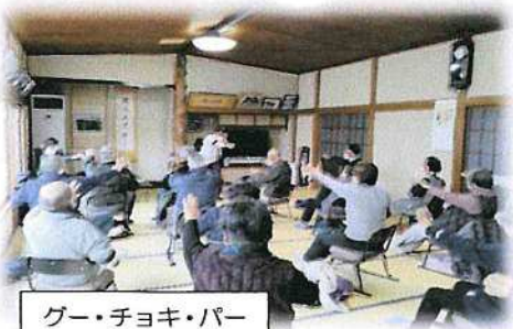
グー・チョキ・パー

清和会による児童公園清掃後の9時30分より、包括支援センターうめその、清和会、自治会の共同事業「第6回介護予防教室」を「軽い体操を楽しみながら頭の働きも高める」という内容で開催しました。右手でグー・チョキをやりながら左手ではグー・チョキ・パーをやるなど、左右違う動きをして頭の働きを高めるなど、なるほどと思うことが多く、体を適度に動かすことで気持ちも軽くなりました。講師の先生、うめそのの皆様、ありがとうございました。