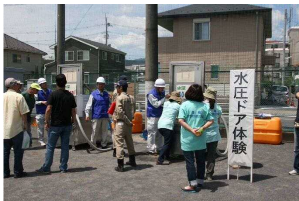
各町からの訓練参加報告