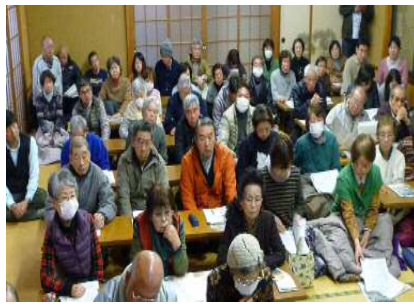
青梅市防災課 4名の講師による講座