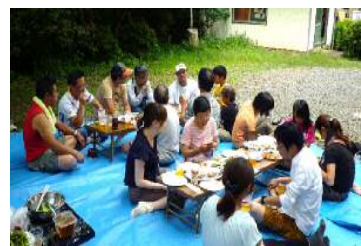
子供参加のバーベキュー大会