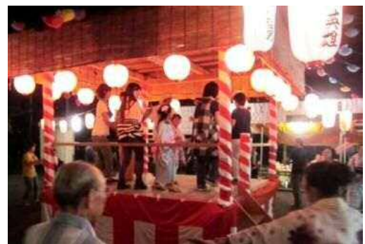
【老若男女が一つの輪（和）になって】

子供たちが参加することで（自治会未加入の）親たちもいっしょに参加され、少しでも多くの地域の人たちとコミュニケーションを深めることができればよいと考えています。