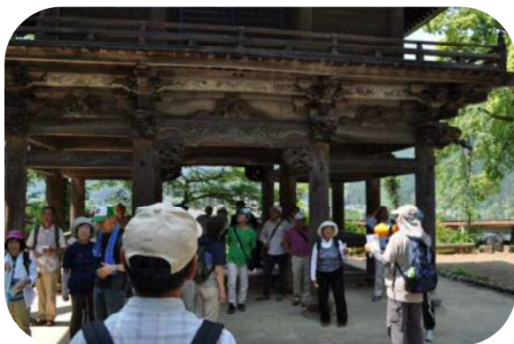
海禅寺山門の歴史を語る