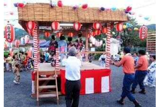
【女性は浴衣、男性は普段着で踊りを】

その大きな役割を果たしているのが、老若男女だれでも気軽に参加することができる「盆踊り大会」です。