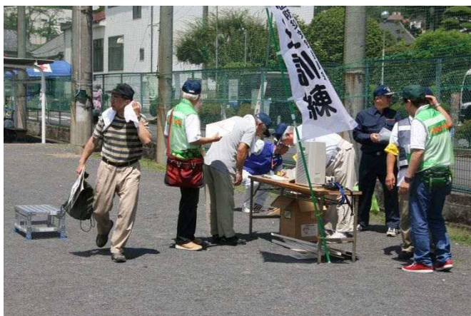
各町からの訓練参加報告