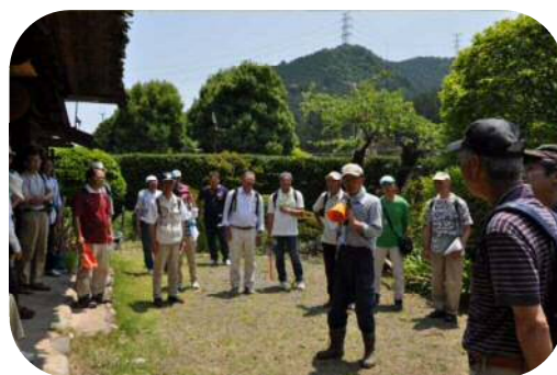
福島邸の庭園で歴史を語る

の説明に耳を傾けました。江戸初期（18世紀中期の建物）の面影を残す、都指定有形文化財の「福島家住宅」3代目当主の説明で、当時の格式高い歴史を学び当地の文化・経済を窺わせました。緑濃い御岳溪谷の遊歩道を歩き、河原の一角で疲れを癒し食事・恒例の抽選会で意義深い「歩こう会」も自由解散となりました。