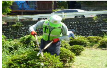
草刈りと河川清掃