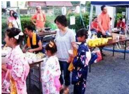
【出店を楽しむ子供たち】

「盆踊り大会」は、地元の踊り愛好会の人たちのご協力により数十年間継続していましたが、昨年愛好会の高齢化による解散に伴い、盆踊り大会の継続に危機が生まれました。