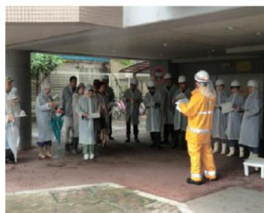
自宅被災後、マンション1階敷地へ避難