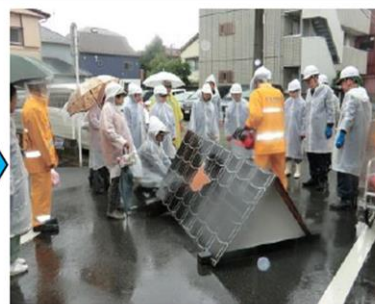
避難途上、倒壊家屋発見・救助