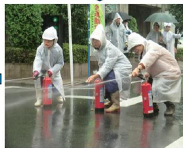
火災発見、街頭消火器による初期消火