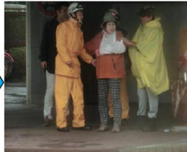
けが人に対する応急救護