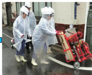
D級可搬ポンプを火災現場へ搬送