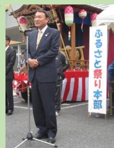
(浜中市長あいさつの様子)

また、例年は市長が開会式に間に合わないことが多かったのですが、今回はギリギリで間に合ったので、ご挨拶をいただくことができました。