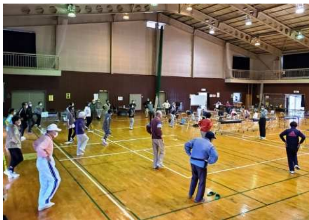
「開眼片足立ち」を行う学生の皆さん