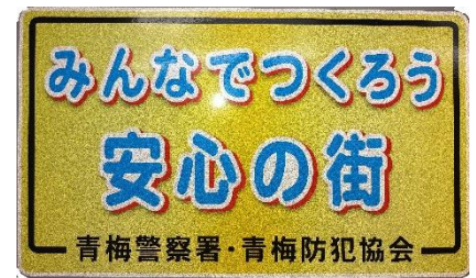
車両に付けたマグネットシート