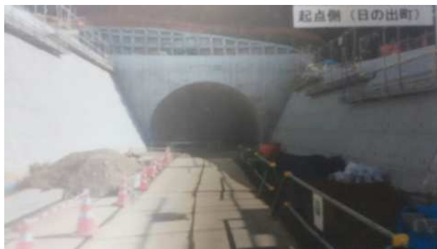
＜梅ヶ谷トンネル日の出側＞