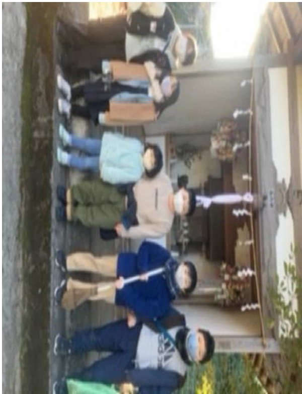
＜社殿の清掃に参加してくれた子供たち＞

祭典当日の朝、和田町子供会の皆さんに社殿の清掃をしていただきました。有難うございました。