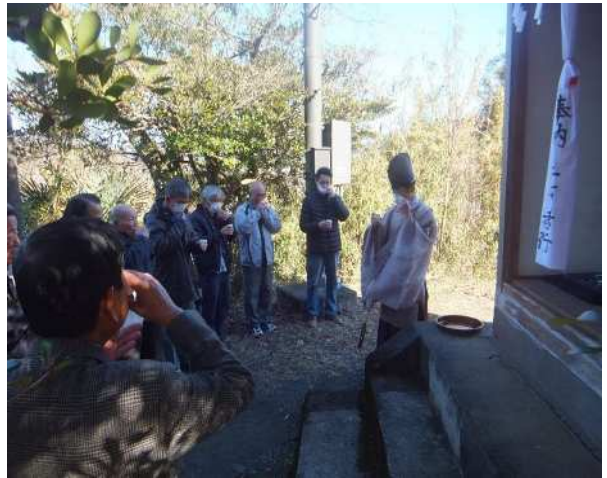
＜宮司さんのお話をいただき御神酒で乾杯＞

神事が行われている際、和田町囃子保存会によるお囃子の演奏で祭典の雰囲気を高めていただきました。有難うございました。