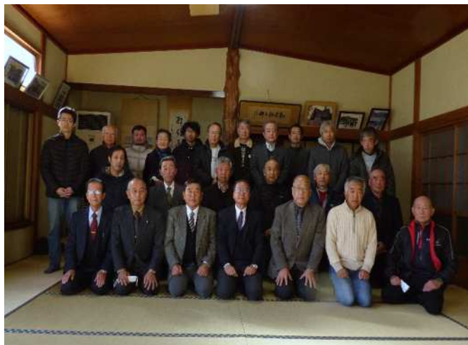
<新年顔合わせ会参観者>

自治会活動の目標の一つでもある会員相互の親睦が安心して出来るように早くなることを願っています。