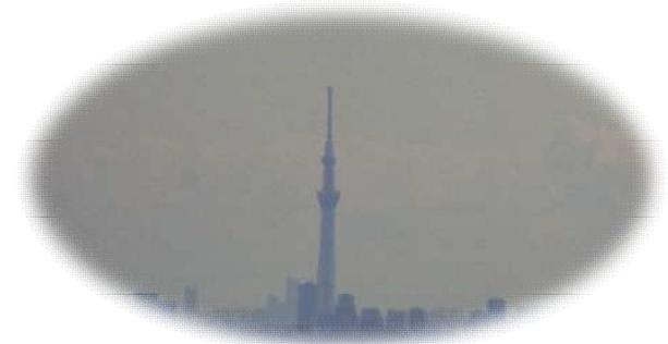
＜赤ぼっこから望遠で写した東京スカイツリー＞