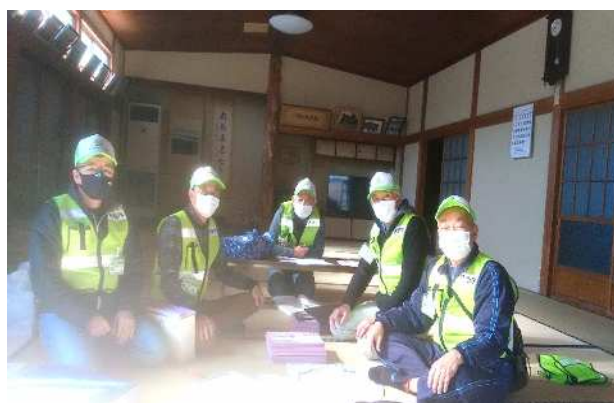
＜カレンダー仕分け中の環境美化委員さん＞

3月6日(日)環境美化委員さんによる「令和4年度青梅市ごみ収集カレンダー」の町内全家庭配布が行われました。