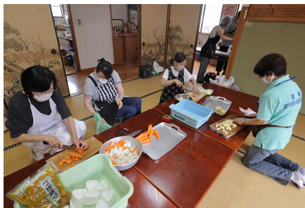
豚汁を作っています