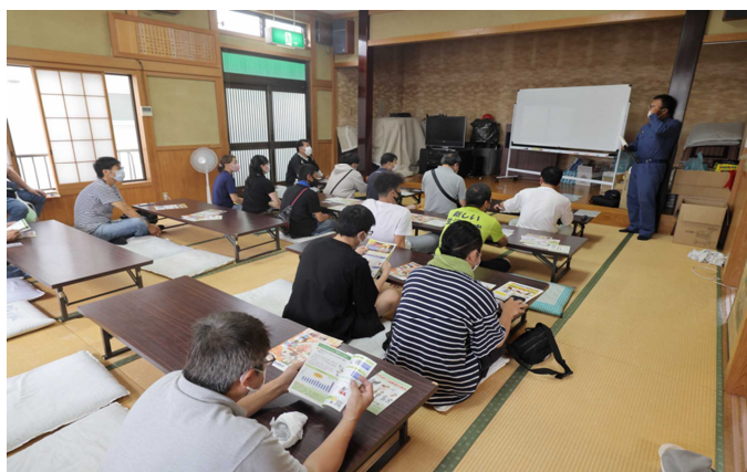
防災講演会の様子

天候の影響により、参加される人が通常より少ない感じでしたが、大人50人、子ども30人が集まりました。久しぶりに会員同士が交流できたこともあって、みなさん楽しく参加している様子が見られました。