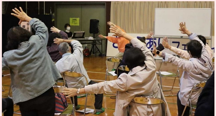
★音楽療法（介護予防対策）★